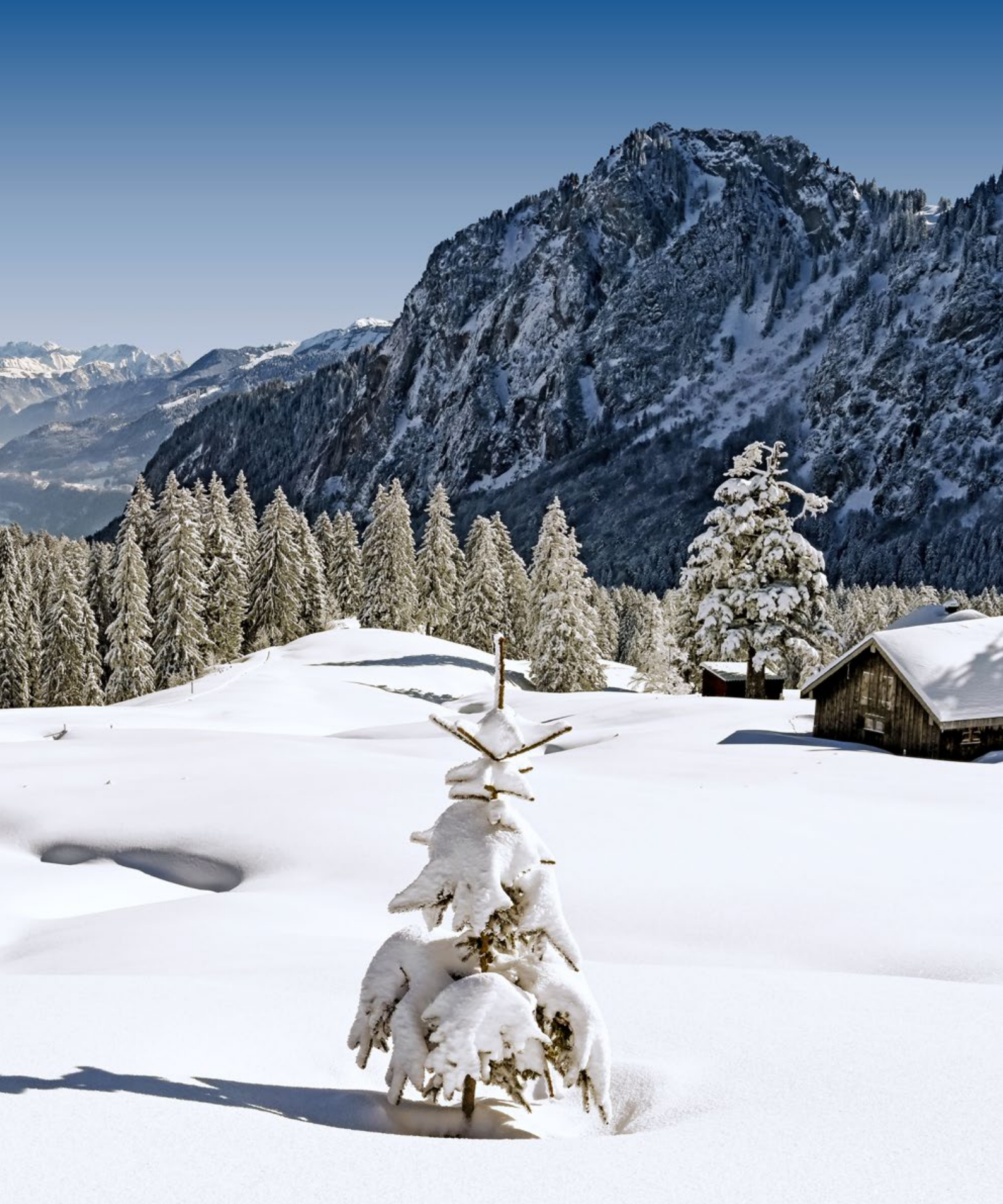
Geologie zum Anschauen beim Aufeinandertreffen von Voralpen und Alpen: links am Talausgang der Planggenstock, rechts der Wageten. Dazwischen liegt das Niederurner Tal. Am Horizont die Churfirnen.