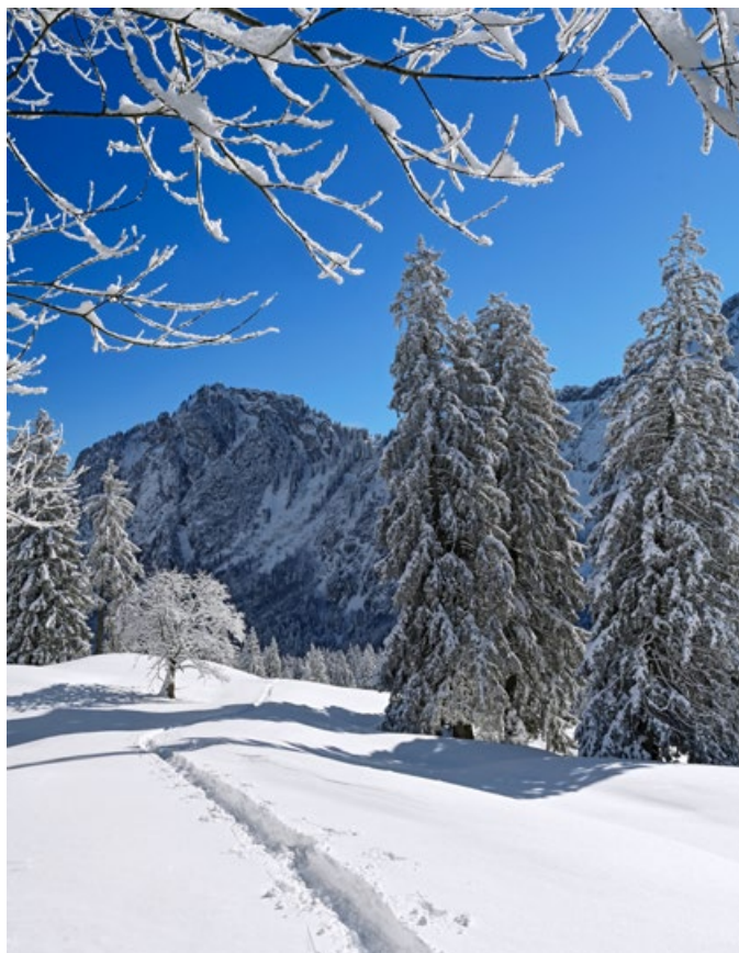
Tief geht es durch den unberührten Schnee, im Hintergrund der Wageten.