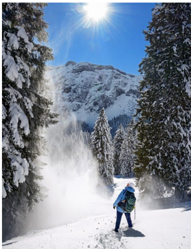
Frisch verschneite Fichten, gleissende Sonne und ein imposanter Brüggl im Hintergrund.

Die Schneeschuhtour ist halb sonnig, halb schattig: Beides zeigt hier seine Reize.