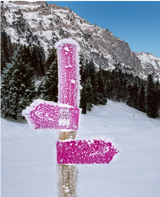
Die Südseite der Tour liegt fast ganztags im Schatten.

südostwärts unterhalb des Hirzli-Gipfels innert 100 Jahren vollständig aufzuforsten. Dies gelang denn auch, die Aufforstung wurde zum Teil sogar mit Arven bestückt, was dem Täli einen besonderen Reiz beschert.